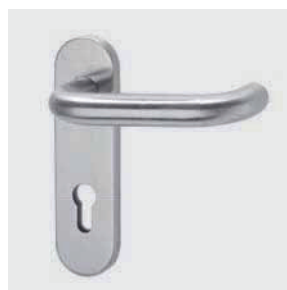
Maniglia M1 INOX

Sono montate su meccanica in acciaio zincato, e vengono fornite complete di quadro 9 x 9 lunghezza 125 mm, viti di fissaggio e distanziali.