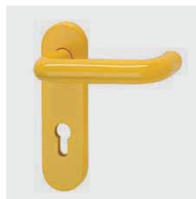
M1C colorata RAL1023

Le confezioni maniglie M1C e M2C sono composte da: una coppia di maniglie a leva (M1C) o combinazione maniglia/pomolo (M2C) in polipropilene (PP) con anima metallica e sottopiacche in acciaio zincato, una coppia di copriplacche in polipropilene (PP) con foro per cilindro europeo, il quadro 9x9 lunghezza 125 mm, le viti di fissaggio ed i distanziali.